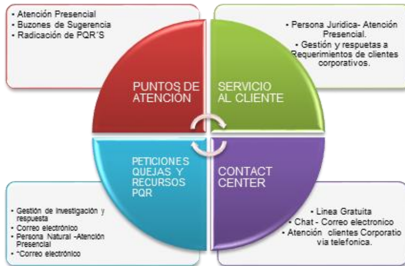
Gráfica 2: Modelo de Atención al Cliente 4-72