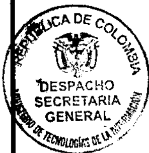
DIEGO MOLANO VEGA

MINISTRO DE TECNOLOGÍAS DE LA INFORMACIÓN Y LAS COMUNICACIONES