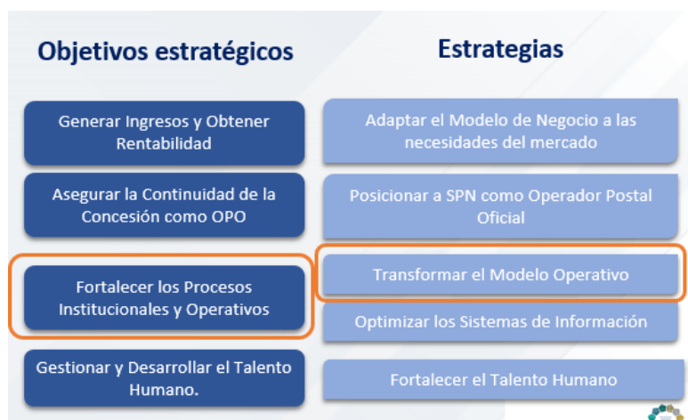
Tabla 1. Perspectiva – Objetivos Estratégicos – Estrategias del Plan táctico 2020~2024.

y al objetivo estratégico de Fortalecer los Procesos Institucionales y Operativos hacia la Transformación del Modelo Logístico 1 actual; detecta la necesidad de encontrar la solución de los principales problemas que se presentan en la operación a través de una solución tecnológica que fortalezca la oferta de servicio del OPO en clientes personal natural y jurídica que intercambian productos en canales digitales y tradicionales promoviendo la optimización de costos operativos y una mejor experiencia de cliente en procesos de distribución-entrega y admisión de paquetes.