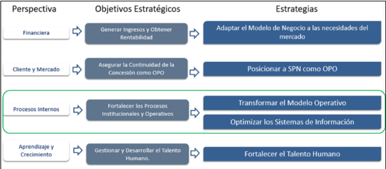
Tabla 1. Perspectiva – Objetivos Estratégicos – Estrategias del Plan táctico 2020~2024.

LA EMPRESA ha definido como transformación: “Transformar el modelo operativo y de negocio de Servicios Postales Nacionales S.A. frente al entorno tecnológico en constante cambio, con el fin de evolucionar su cadena de valor para generar una transición armónica hacia la era digital centrada en el cliente, impactando la eficiencia, calidad y mejora en la entrega de sus productos y servicios a través de la apropiación de tecnologías de última generación como parte vital de su proceso misional, propendiendo por la apropiación y titularidad exclusiva de su know how.”