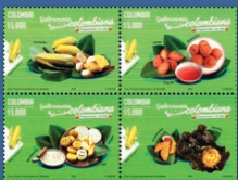
4 Gastronomía colombiana Marzo 15. Valor facial $5.000 pesos. Tiraje 50.004 unidades. Pliego con doce estampillas. WNS CO032.18 al CO035.18