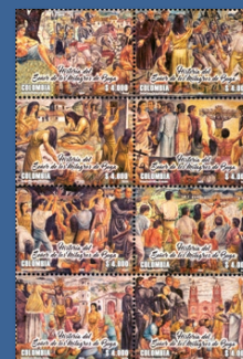
25 Historia del Señor de los Milagros de Buga Diciembre 13. Valor facial $4.000 pesos. Tiraje 22.896 unidades. Pliego con ocho estampillas WNS CO111.18 al CO118.18