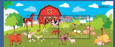
20 América Upaep 2018 - Animales domésticos Octubre 9. Valor facial $4.000 pesos. Tiraje 48.716 unidades. Hoja filatélica con dos estampillas. WNS CO105.18 y CO106.18