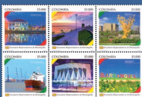
8 Escenarios Representativos de Barranquilla Mayo 18. Valor facial $5.000 pesos. Tiraje 70.002 unidades. Pliego con seis estampillas. WNS CO040.18 al CO045.18