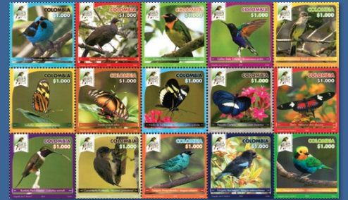
18 Risaralda Bird Festival 2018 Agosto 24. Valor facial $1.000 pesos. Tiraje 311.175 unidades. Pliego con quince estampillas. WNS CO089.18 al CO103.18