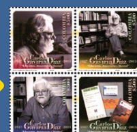
26 Carlos Gaviria Díaz 1937-2015 Diciembre 17. Valor facial $500 pesos. Tiraje 50.000 unidades. Pliego con ocho estampillas WNS CO119.18 al CO122.18