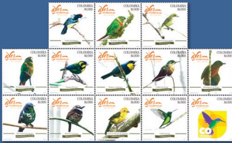
1 Aves Endémicas de Colombia Enero 23. Valor facial $1.000 pesos. Tiraje: 60.008 estampillas. Pliego con trece estampillas. WNS CO001.18 al CO013.18