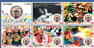
3 Centenario de la primera Reina del Carnaval de Barranquilla 1918-2018 Febrero 9. Valor facial $3.000 pesos. Tiraje 60.000 unidades. Pliego con seis estampillas. WNS CO026.18 al CO031.18