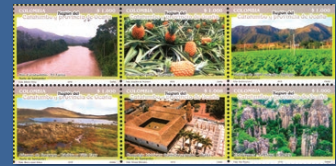
17 Región del Catatumbo y Provincia de Ocaña Agosto 17. Valor facial $1.000 pesos. Tiraje 163.248 unidades. Pliego con seis estampillas. WNS CO083.18 al CO088.18