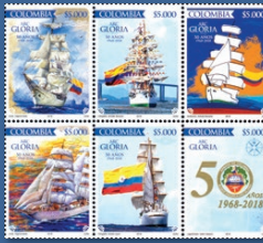
14 Buque Escuela ARC Gloria 50 años 1968-2018 Julio 24. Valor facial $5.000 pesos. Tiraje 159.906 unidades. Pliego con seis estampillas. WNS CO055.18 al CO060.18