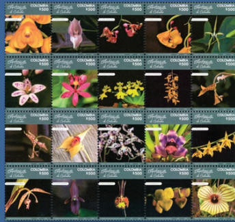
15 Orquídeas Endémicas de Colombia Agosto 9. Valor facial $500 pesos. Tiraje 293.060 unidades. Pliego con veinte estampillas. WNS CO062.18 al CO081.18