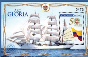
14 Buque Escuela ARC Gloria 50 años 1968-2018 Julio 24. Valor facial $100.000 pesos. Tiraje 1.800 unidades. Hoja filatélica con una estampilla. WNS CO061.18