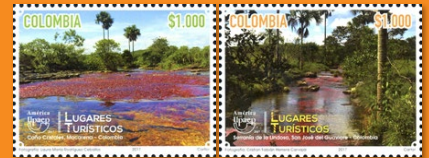
15 America Upbeat 2017 - Lugares Turísticos Octubre 9. Valor facial $1.000 pesos. Tiraje 60.000 unidades. Pliego con doce estampillas. WNS CO043.17 y CO044.17