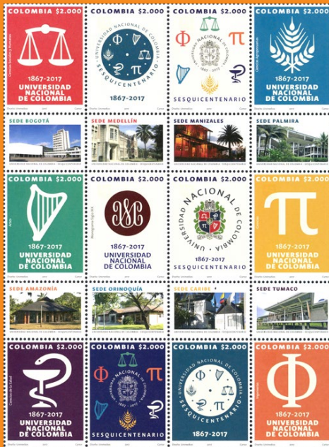
12 Sesquicentenario Universidad Nacional de Colombia 1867-2017 Agosto 31. Valor facial $2.000 pesos. Tiraje 89.856 unidades. Pliego con doce estampillas. WNS CO029.17 al CO040.17