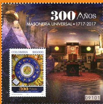
7 Masonería Universal 300 años 1717-2017 Julio 6. Valor facial $10.000 pesos. Tiraje 10.000 unidades. Hoja filatélica con una estampilla WNS CO021.17