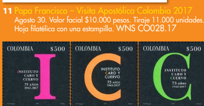
10 Instituto Caro y Cuervo 75 años 1942-2017 Agosto 24. Valor facial $500 pesos. Tiraje 240.030 unidades. Pliego con cuarenta y dos estampillas. WNS CO024.17 al CO026.17