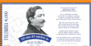
6 Julio Flórez sesquicentenario de su natalicio 1867-2017 Mayo 26. Valor facial $1.000 pesos. Tiraje 30.006 unidades. Pliego con nueve estampillas. WNS CO019.17