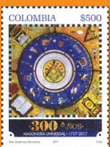
7 Masonería Universal 300 años 1717-2017 Julio 6. Valor facial $500 pesos. Tiraje 40.977 unidades. Pliego con nueve estampillas Código WNS CO020.17