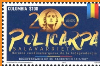
13 Policarpa Salavarrieta Bicentenario de su sacrificio 1817-2017 Septiembre 14. Valor facial $100 pesos. Tiraje 400.032 unidades. Pliego con treinta y seis estampillas WNS CO041.17