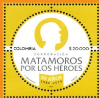
9 Corporación Matamoras 30 años 1986-2016 Agosto 14. Valor facial $20.000 pesos. Tiraje 15.000 unidades. Hoja con dos estampillas WNS CO023.17