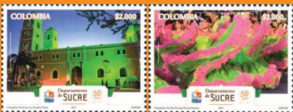
1 Departamento de Sucre 50 años 1967-2017 Marzo 1. Valor facial $2.000 pesos. Tiraje 60.000 unidades. Pliego con dieciséis estampillas. WNS CO001.17 y CO002.17