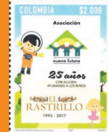
16 Asociación Nuevo Futuro de Colombia 25 años 1993 - 2017 Octubre 18. Valor facial $2.000 pesos. Tiraje 60.000 unidades. Pliego con dieciséis estampillas WNS CO045.17