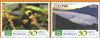
3 Departamento de Risaralda 50 años 1967-2017 Abril 7. Valor facial $500 pesos. Tiraje 80.000 unidades. Pliego con dieciséis estampillas. WNS CO004.17 y CO005.17