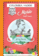
22 María de Jorge Isaacs 150 años 1867-2017 Diciembre 15. Valor facial $4.000 pesos. Tiraje 40.000 unidades. Pliego con cuatro estampillas WNS CO052.17