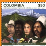
8 Federación Nacional de Cafeteros de Colombia 90 años 1927-2017 Julio 10. Valor facial $50 pesos. Tiraje 378.480 unidades. Pliego con cuarenta y ocho estampillas WNS CO022.17