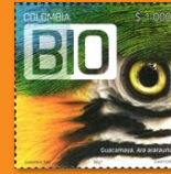
14 Programa Colombia Bio Septiembre 22. Valor facial $1.000 pesos. Tiraje 41.004 unidades. Pliego con nueve estampillas WNS CO042.17