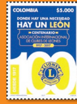
17 Centenario Asociación Internacional de Clubes de Leones 1917-2017 Octubre 30. Valor facial $5.000 pesos. Tiraje 30.000 unidades. Pliego con seis estampillas WNS CO046.17