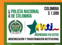
21 Policía Nacional de Colombia 126 años 1891-2017 Diciembre 7. Valor facial $1.000 pesos. Tiraje 40.000 unidades. Pliego con ocho estampillas WNS CO051.17