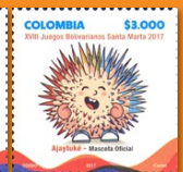
18 XVIII Juegos Bolivarianos Santa Marta 2017 Noviembre 10. Valor facial $3.000 pesos. Tiraje 40.008 unidades. Pliego con doce estampillas. WNS CO047.17 y CO048.17