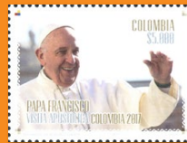
11 Papa Francisco Visita Apostólica Colombia 2017 Agosto 30. Valor facial $5.000 pesos. Tiraje 38.000 unidades. Pliego con cuatro estampillas WNS CO027.17