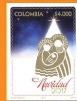
20 Navidad 2017 Diciembre 1. Valor facial $4.000 pesos. Tiraje 50.004 unidades. Pliego con seis estampillas WNS CO050.17