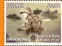
19 Infantería de Marina 80 años 1937-2017 Noviembre 30. Valor facial $10.000 pesos. Tiraje 40.000 unidades. Pliego con ocho estampillas WNS CO049.17