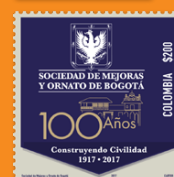
23 Sociedad de Mejoras y Ornato de Bogotá 100 años 1917-2017 Diciembre 20. Valor facial $200 pesos. Tiraje 80.000 unidades. Pliego con veinte estampillas WNS CO053.17