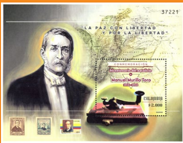
2 Bicentenario del Natalicio de Manuel Murillo Toro 1816-2016 Marzo 24. Valor facial $2.000 pesos. Tiraje 60.000 unidades. Hoja filatélica con una estampilla. WNS CO003.17